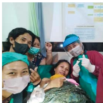
(Kala IV persalinan)