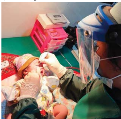
(Pemberian salf mata)