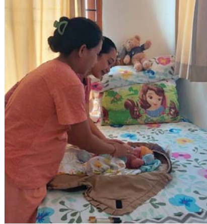
(Mengajarkan ibu melakukan pijat bayi tanggal 01 April 2023)