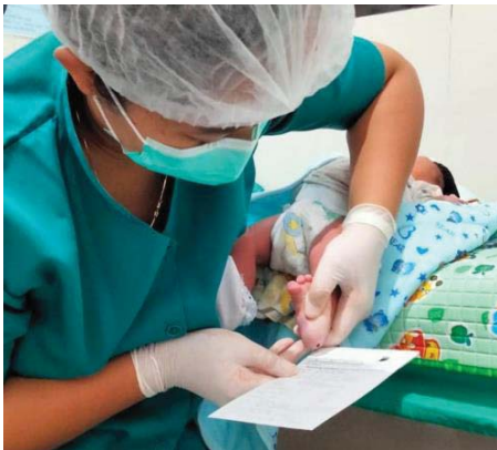
(Melakukan pemeriksaan SHK tanggal 01 April 2023)