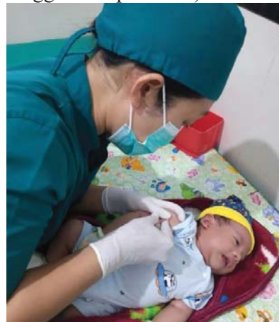
(Melakukan imunisasi BCG dan Polio tanggal 22 April 2023)