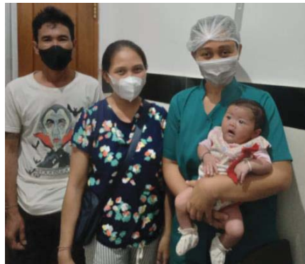
(Dokumentasi 09 Mei 2023)