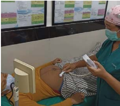
(Asuhan pada tanggal 04 Maret 2023)