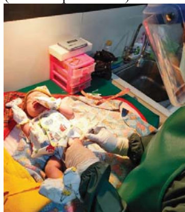
(Injeksi Vitamin K)