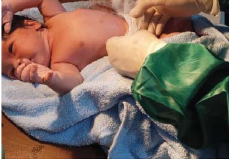
(Asuhan pada bayi tanggal 31 Maret 2023)