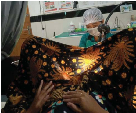
(Pemasangan KB IUD)