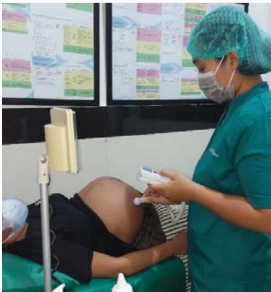
(Asuhan pada tanggal 22 Maret 2023)