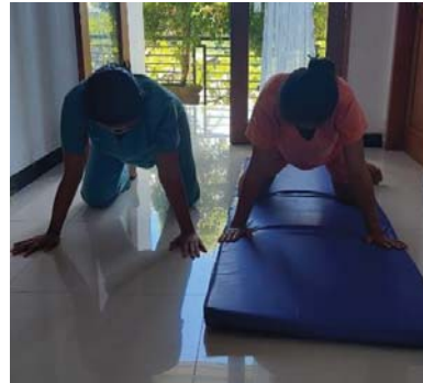
(Asuhan pada tanggal 15 Maret 2023)