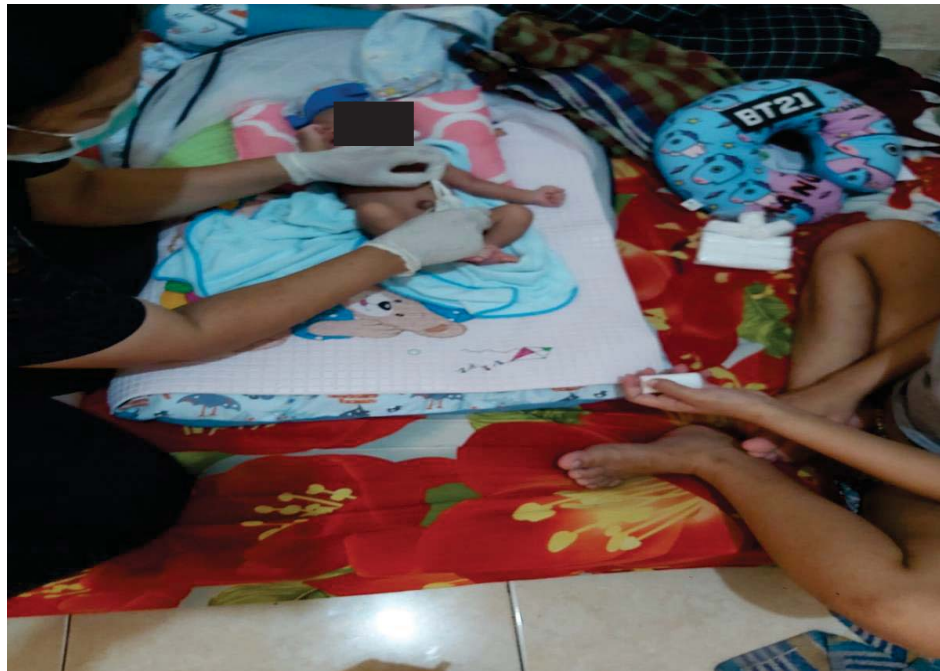
Dokumentasi KN 1