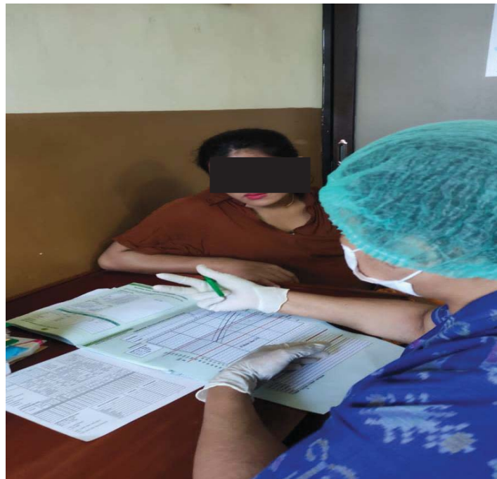
Dokumentasi Kunjungan ANC 2