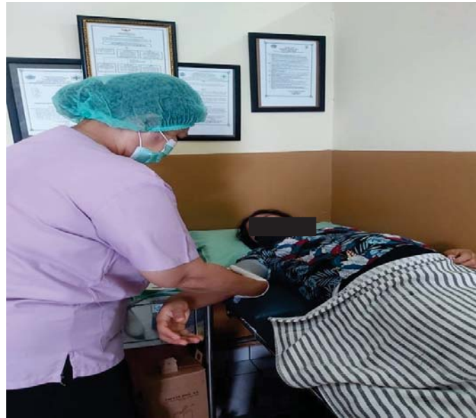
Dokumentasi Kunjungan ANC 3