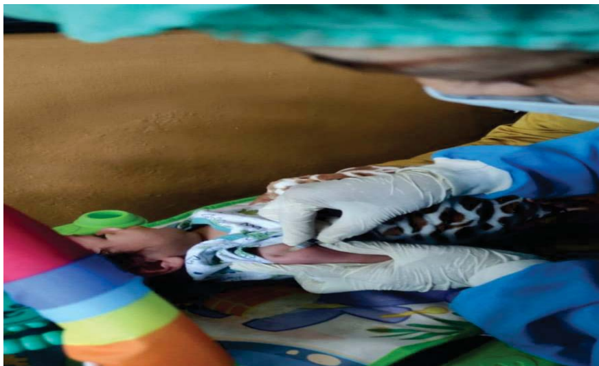
Dokumentasi KN 3