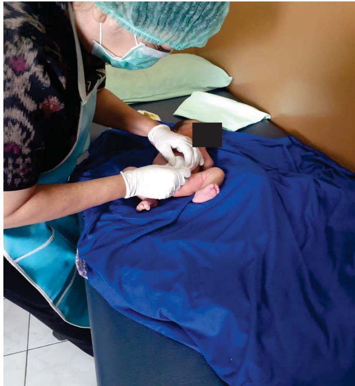
Dokuemntasi KN 2