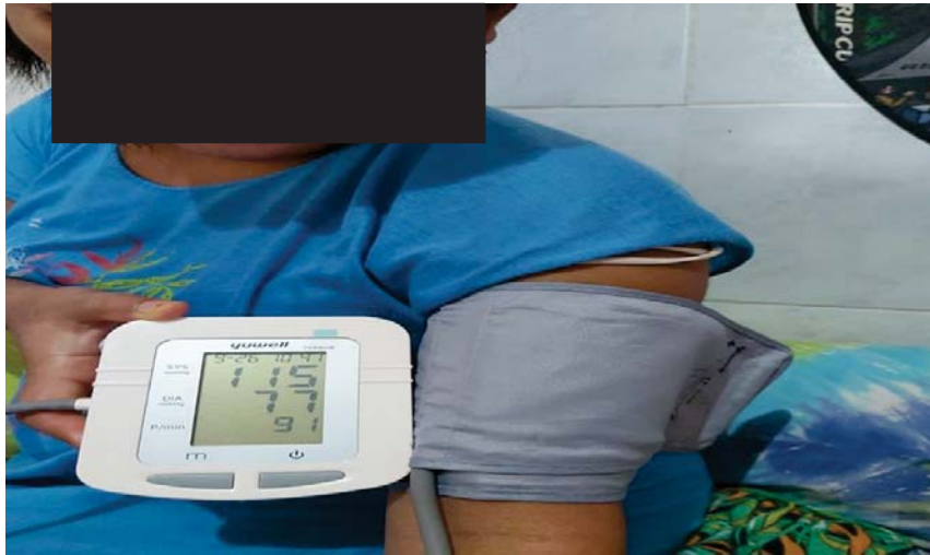
Dokumentasi Kunjungan Nifas