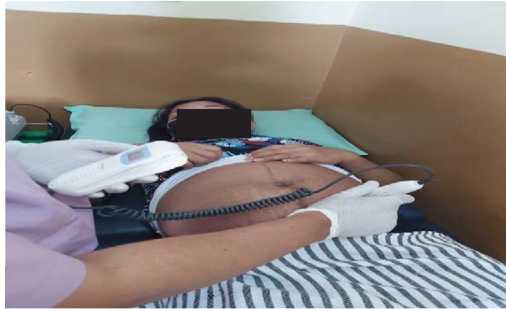
Dokumentasi Kunjuangan ANC 1