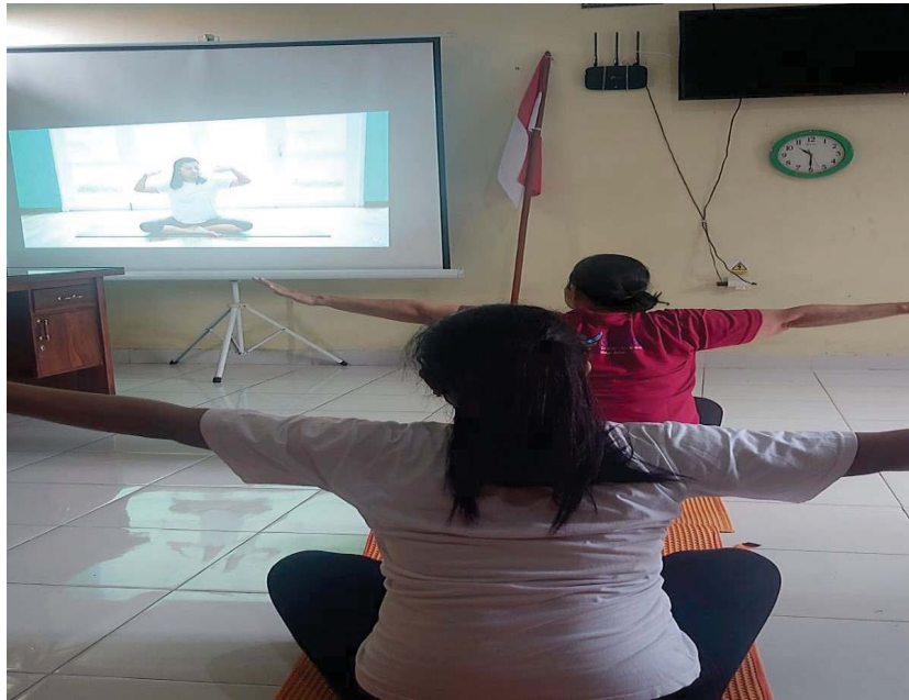
Dokumentasi Senam Hamil